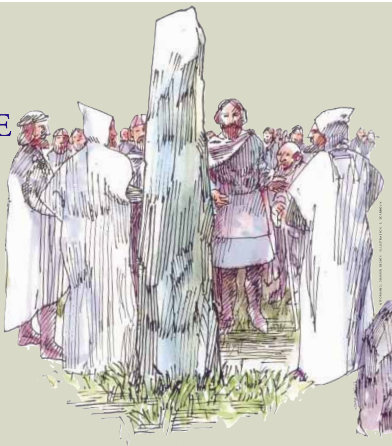
GRAVESTONES AT VIKEVÅG

These burial memorials at the Millennium Park in Vikevåg tell of wealth and political power in prehistoric times. No archaeological excavations have been made in any of the mounds and nor are any relics from them known. Therefore they are impossible to date. But the location of the memorial stone and grave mound can suggest a Viking origin (c.800-1000 AD). Other isolated finds in this area date from the Stone Age and Bronze Age.