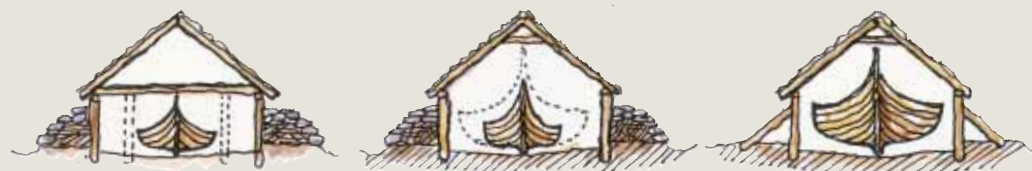
Døme på naustkonstruksjonar.

Das Fundament befindet sich heute ein paar Meter oberhalb des Wasserspiegels, was darauf schließen lässt, dass das Bootshaus in der Zeit der Völkerwanderung entstand. (400-600 n. Chr.)