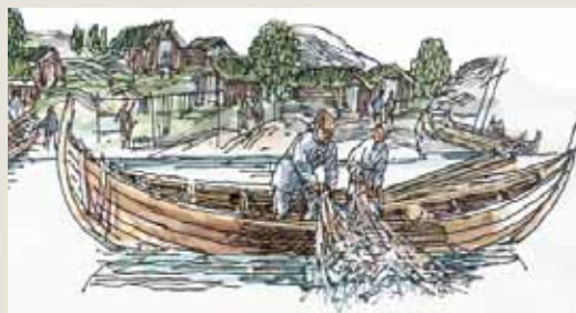
HÅRR GRAVES, BOATSHEDS AND SILVER TREASURE